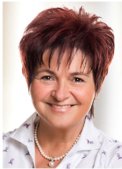
Bürgermeisterin Gerlinde Schneider

Sprechstunden montags und mittwochs jeweils von 8 bis 9 und freitags von 16 bis 17 Uhr.